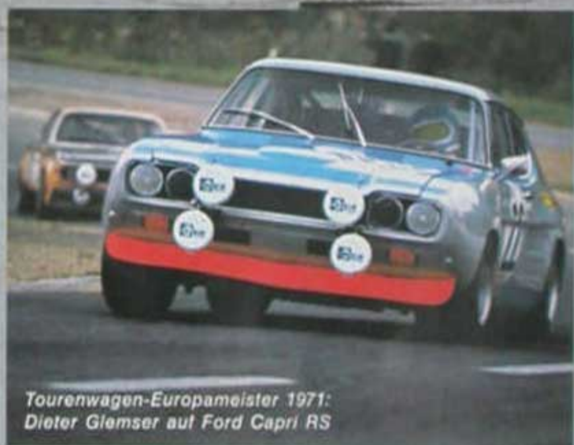
Tourenwagen-Europameister 1971: Dieter Glemser auf Ford Capri RS